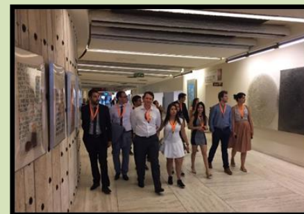
Alunos em visita à ONU

Experiência Internacional em um contexto de gestão européia